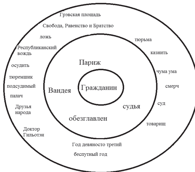
Ил. 2. Структура номинативного поля концепта ФРАНЦУЗСКАЯ РЕВОЛЮЦИЯ

ются к Лозэну в тюрьме. Через эту номинацию происходит связь образов Лозэна и Французской революции, так как номинация «гражданин» входит в ближнюю периферию концепта ЛОЗЭН. Также пересечение данных концептов происходит в области дальней периферии — через номинации «Республиканский вождь», «ложь» и «приговор».