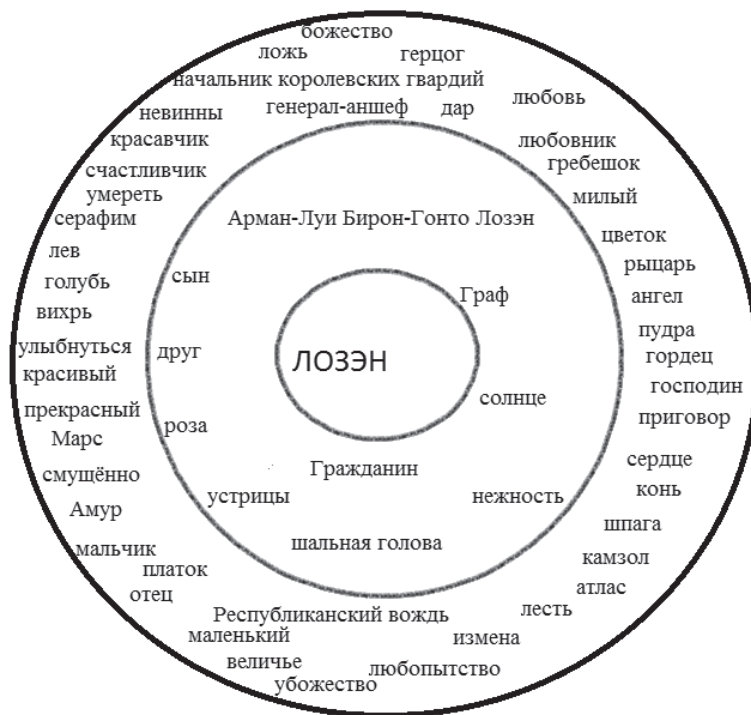
Ил. 1. Структура номинативного поля концепта ЛОЗЭН

как в тексте героев, так и в ремарках автора. В ближнюю периферию номинативного поля мы включили номинации, упомянутые в тексте пьесы три и более раз. Остальные номинации вошли в дальнюю периферию номинативного поля.