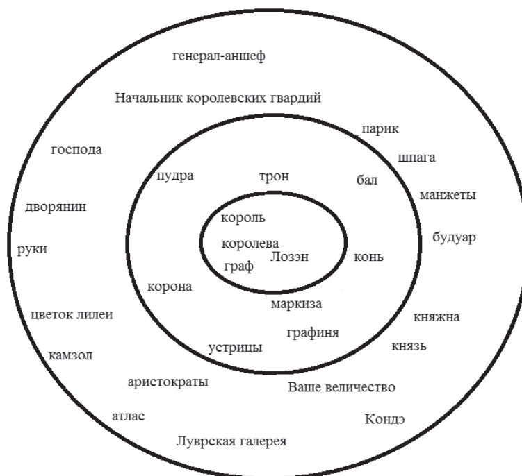
Ил. 4. Структура номинативного поля концепта АРИСТОКРАТИЯ

нительную коннотацию «счастье», «удача». Данная номинация дает поэту возможность использовать такие номинации, как «колесо Фортуны» и «поцелуй Фортуны», и подчеркнуть изменчивость удачи. Таким образом, ближняя периферия номинативного поля состоит из единственной номинации — «Фортуна» (9 упоминаний), а в дальнюю периферию входят семь номинаций, упомянутых по два или одному разу. Несмотря на название пьесы, вербализация этого концепта представлена в меньшей степени, чем вербализация остальных основных концептов пьесы. Номинации «роза», «дар» и «счастливчик» связывают концепты СУДЬБА и ЛОЗЭН. Роза — наиболее часто используемый Цветаевой символ в пьесе. Именно этот символ связывает судьбу и любовь в тексте.